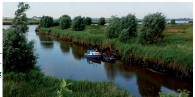
Vergangene Idylle in Reimersbude: Heute dürfen dort keine Boote mehr liegen.

Im ersten Fall lag nur ein Angebot vor, im zweiten Fall kümmerte man sich nicht selbst um die Angebote, sondern ließ die „Spielplatz“-Väter diese Arbeit machen.